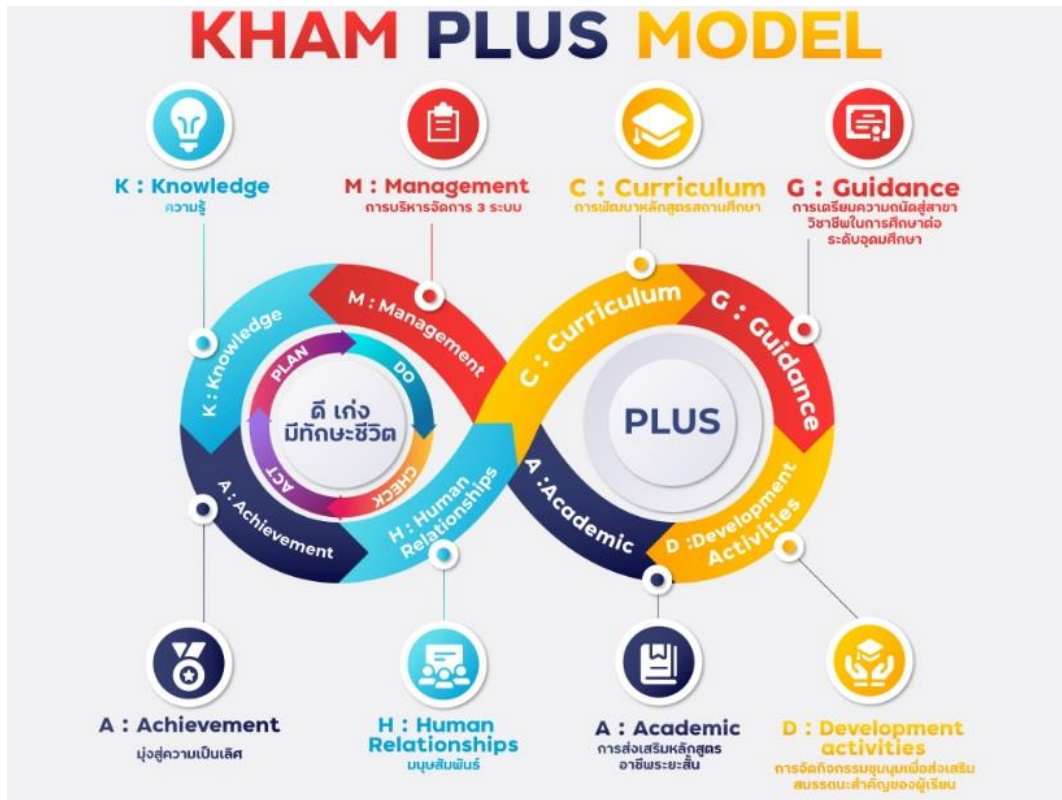
วงจร KHAM PLUS MODEL